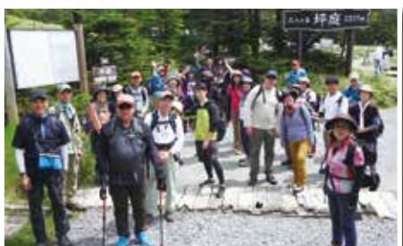
ファミリートレッキング

これからも、江名子校区の益々の発展に繋がる為に、一段と団結して盛り上がって行って下さい。2年間有難うございました。