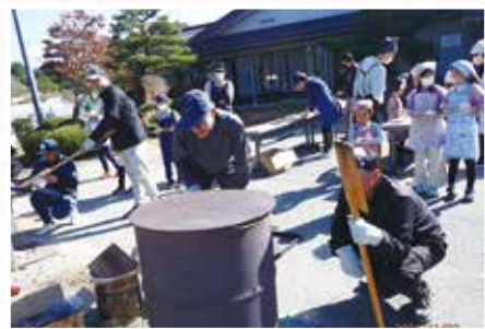
ドラム缶ピザ作り

令和6年度、子ども会育成委員長を務めさせていただきました。各町内単独での行事が減少する中、まち協として「ドラム缶ピザ作り」「ペットボトルボウリング大会」の2つの行事を行わせていただきました。いずれの行事も私が想定していた以上の参加人数で、また参加した子どもが皆本当に楽しそうだったのが印象的でした。最近では、各家庭でのスポーツや習い事が盛んで、地域の行事に参加する子どもは減っていると言われていますが、すべての家庭が習い事等ができるわけではなく、その場合は地域での行事は重要な役割を担っていると実感しました。子どもの笑顔は地域の宝です。すべての子どもの笑顔を守っていくためにも、まち協として、できる範囲で、子ども向けの行事を継続していただけたら幸いです。